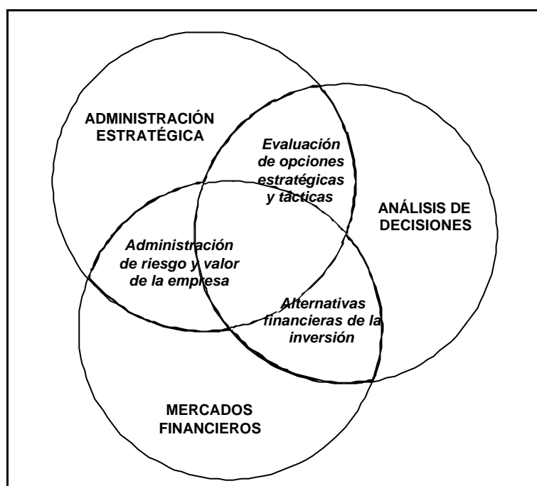
Figura 1 Tres ámbitos significativos para los instrumentos de evaluación de inversiones

Si se entiende que las opciones reales son una variedad de las opciones estratégicas y tácticas, el área en el centro del diagrama sería el espacio de las opciones reales en sentido estricto.