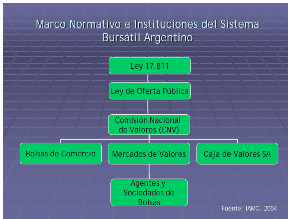
Figura 1. Instituciones del Sistema Bursátil Argentino

Las operaciones son concertadas en un período de tiempo llamado rueda , durante el cual los representantes de las Sociedades de Bolsa o Agentes realizan sus ofertas de compra o venta. Dado el incremento en la cantidad de operaciones, el avance de la tecnología y la dispersión geográfica, todas las operaciones son cargadas en sistemas informáticos habilitados a tal fin. En este sentido, las ofertas de compra o venta son ingresadas electrónicamente desde estaciones remotas de trabajo (o terminales), ubicadas en cada una de las oficinas de los Agentes y Sociedades de Bolsa. En la Figura 2 mostramos cómo se negocian los títulos valores.